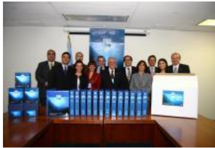
Presentación Argentina del 21 de abril de 2009 ante la CPLC