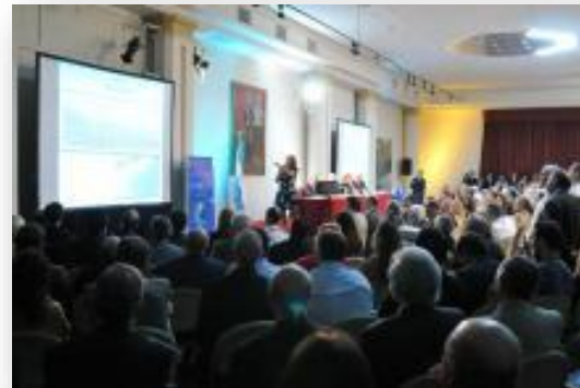
Argentina Presentó el Límite exterior de su Plataforma Continental ( 2016 – Palacio San Martín)